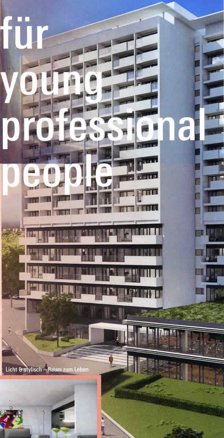
Licht &amp; stylisch – Raum zum Leben

„Colour your life“ – darauf zielt die FEROX Immobiliengruppe mit ihrem Projekt „WhiteMax“ am Seestern. Das Leben bunter zu machen, ihm mehr Farbe zu geben, soll nämlich daheim beginnen. Das höchste Wohnhaus Düsseldorfs mit Blick auf die Markenzeichen der Stadt hat dafür alle Voraussetzungen: Die Emanuel-Leutze-Straße 1 ist die neue Trendadresse der NRW-Landeshauptstadt für junge Menschen, die den Puls der Rheinmetropole ebenso genießen wie Job und Karriere, die Lebenslust und Freizeitgestaltung mit Sport und Spaß pflegen. Ein quasi maßgeschneidertes, schickes Zuhause, das Stil, Energie und Dynamik der „urban people“ spiegelt, ist „WhiteMax“ – stylisch, stadtnah, im Grünen gelegen und nahe am Rhein.