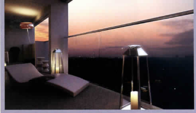
Wohnen mit Weitblick: Terrasse über den Dächern Düsseldorfs