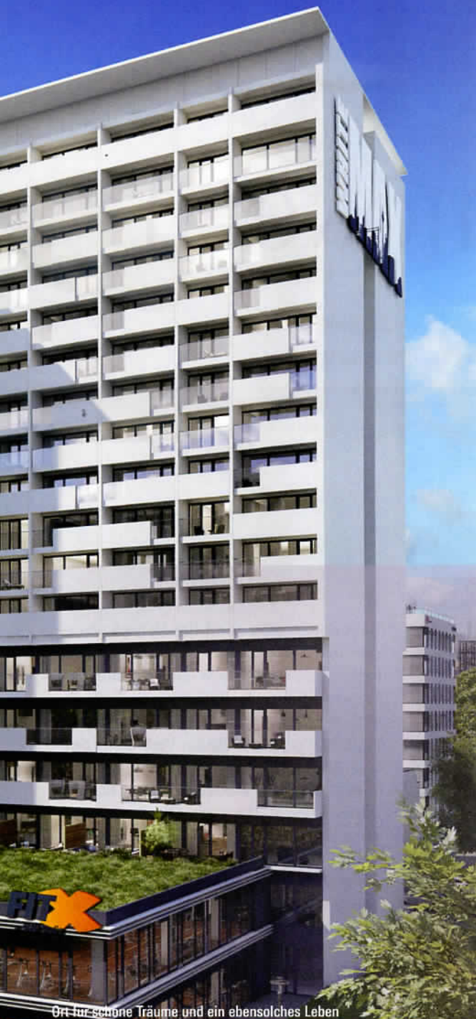
Ort für schöne Träume und ein ebensolches Leben